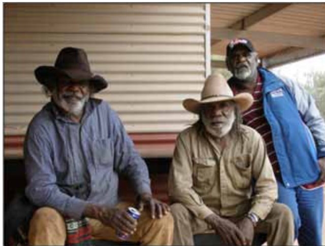
Figura 5. Autoridades tradicionales de APY (G. McWilliams, 2009).

Por otro lado, los anangu tienen reglas estrictas de conducta y en particular de relaciones de parentesco. Las faltas y las sanciones resultantes mantienen el orden en la vida diaria y las violaciones a las reglas de matrimonio entre clanes, o por los casamientos horizontales entre