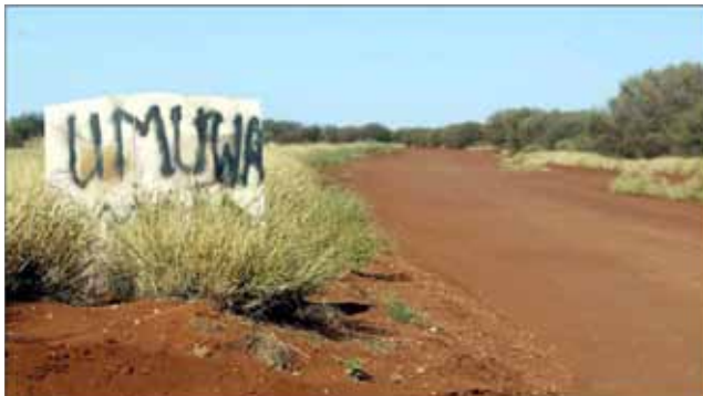
Figura 1. Entrada a Umuwa, APY (M. Burton, 2009).

A partir de este breve contexto, quiero compartir algunas notas relativas a este grupo y sus procesos del pasado y el presente. De modo inicial me enfocaré en las condiciones generales de vida y sus relaciones con el gobierno y los otros foráneos que actúan en su vida cotidiana. De ningún modo pretendo efectuar un acercamiento exhaustivo sino tan sólo una introducción sintética al contexto de la vida material de los aborígenes que viven en este territorio. Esto tiene la finalidad de abrir una ventana a la discreta vida de un pueblo que pasa casi por completo inadvertido para el mundo exterior. Debo señalar que, en virtud de las prohibiciones para tomar y publicar fotografías, sólo me permito incluir las imágenes autorizadas por la comunidad.