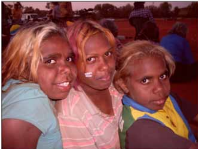
Figura 6. Niñas en Umuwa, APY (C. Harriss, 2012).

Otro motivo que explica la falta de “éxito” académico de los alumnos anangu se relaciona con el calendario ceremonial que las escuelas no