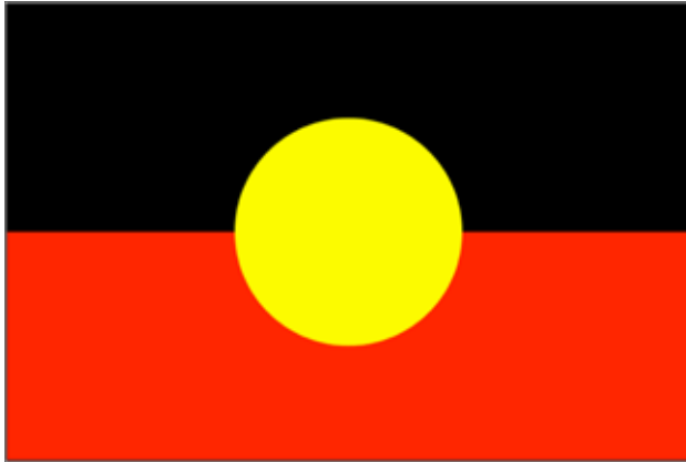
Figura 3. La bandera de los aborígenes australianos.

distancias de una a cuatro horas en camioneta. En general, los precios locales son inalcanzables para la población, a pesar de que la mayoría de los anangu trabaja o recibe algún tipo de subsidio gubernamental. El hambre y la desnutrición son fenómenos comunes, si bien la cacería del canguro y la recolección aún son parte de su dieta y vida cotidiana.