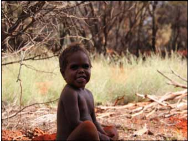
Figura 4. Un niño jugando en el campo en Pukatja, APY (J. Muhic, 2012).

Por otro lado, en las tierras APY existe la población más numerosa del mundo de camellos silvestres (~ 1 000 000), que de forma original introdujeron como bestias de carga comerciantes paquistaníes en el siglo XIX. En años recientes, algunos vaqueros aborígenes con experiencia en los ranchos se encuentran en el proceso de exportar a países del Medio Oriente interesados en el consumo de carne de camélido. Además, una pequeña cantidad de la carne se expende a restaurantes en las ciudades de la región.